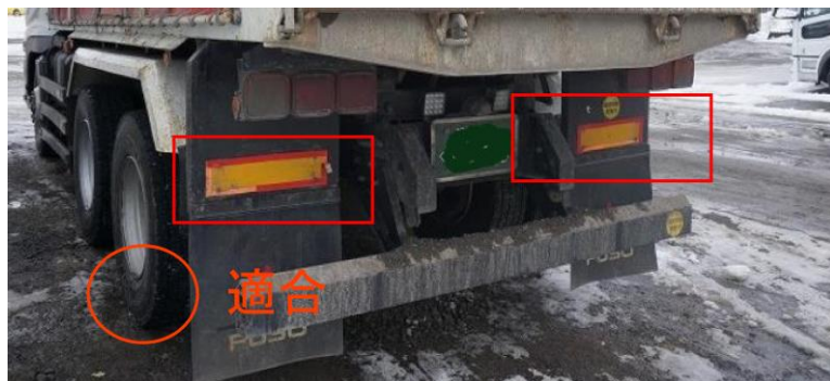
平成23年8月以前製作車