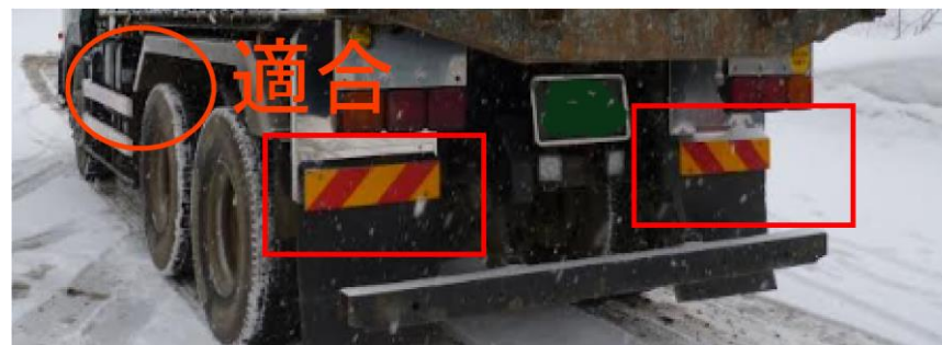
平成23年9月以降製作車